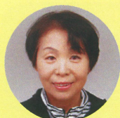
同窓会事務局 事務局員