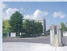
※P32に関連記事を掲載しています。