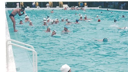
昭和50年頃 島大プール

その後、大学に50メートル、8コースの立派なプールが昭和39年に新設され、3日間の水泳訓練のうち前半の2日をプールできめ細かい指導を行い、3日目には海へ移動して遠泳の実技訓練を行うスタイルがとられるようになった。