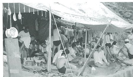
昭和36年 実施 本部テント

第2回は翌年の昭和31年7月17日から3日間古浦海岸で実施された。教師(特に義務教育諸学校)の資格として必要な水泳に関する知識技能の向上をはかることを目的とし、学部1年生全員を対象として実施された。