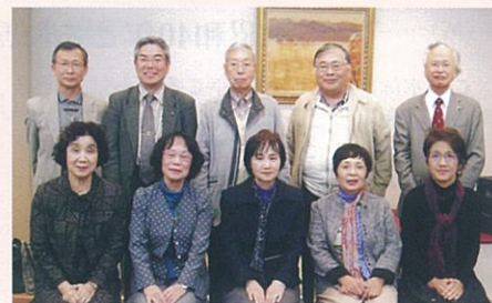
「昭和41年小学課程入学」 〈昭和41年入学〉(10月24日)