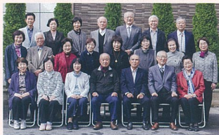
「友朋同窓会」 〈昭和36年卒業〉(10月25日)